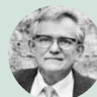
Søren Ulrik Thomsen Lyriker og essayist